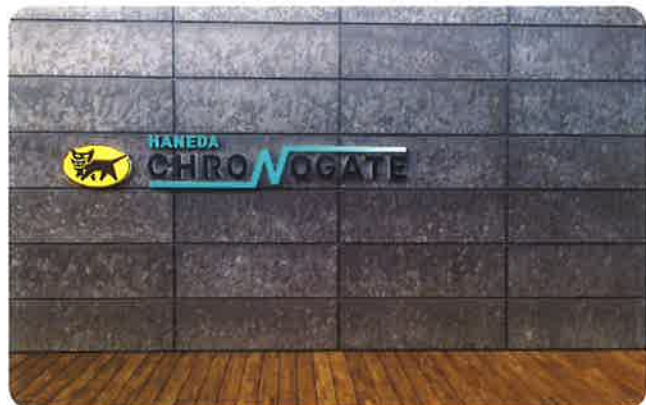
事務所エントランス