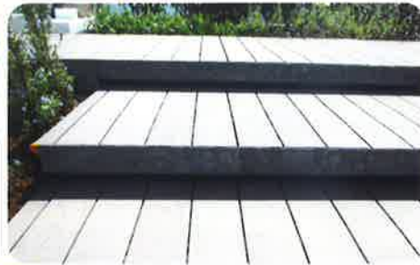
都市部 歩行者広場